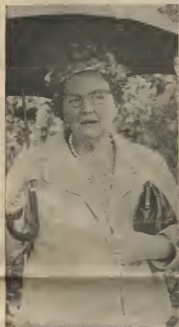
AWAGERO A DISAPUNTA REINA

Konsecuentenan grandi a ser topeda pa e berdad cu